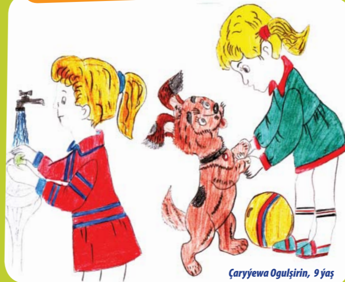
Çaryýewa Ogulşirin, 9 ýaş

Çagalar! Siziň dostlaryňyz arassaçylyk barada näme pikir edýärler, geliň tanyşalyň!